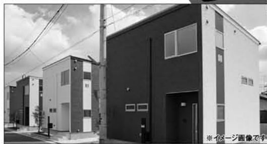
※イメージ画像です

標準仕様 ●人造大理石トップのシステムキッチン ●ゆったり足を伸ばして入れる1.0坪ユニットバス